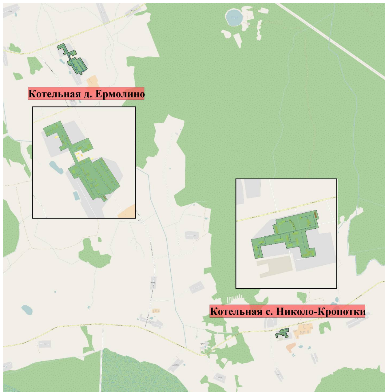
Рисунок 3 – Зоны действия котельных

Строительство новых источников централизованного теплоснабжения в сельском поселении Ермолинское на перспективу не планируется. Зоны действия источников централизованного теплоснабжения представлены на рисунке 3.